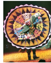
エジプト タンヌーラ舞踊