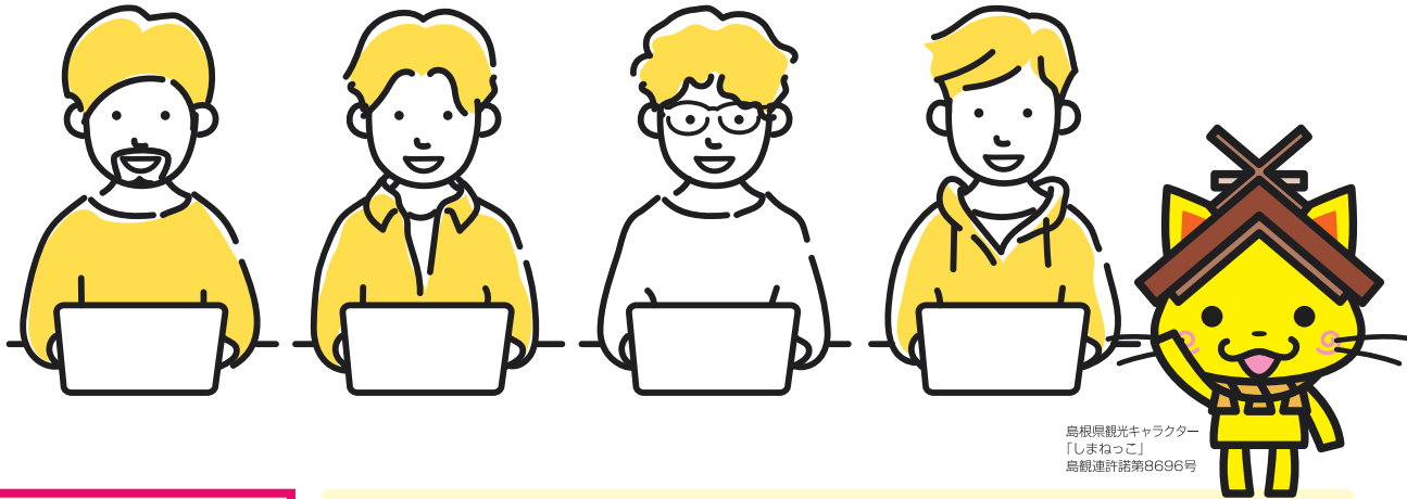
島根県観光キャラクター 「しまねっこ」 島根連許諾第8696号

島根県内のIT企業で5日以上のインターンシップに参加することで、県内IT企業の魅力を学ぶとともに、Ruby・JavaなどのIT関連技能を身に付けることができます